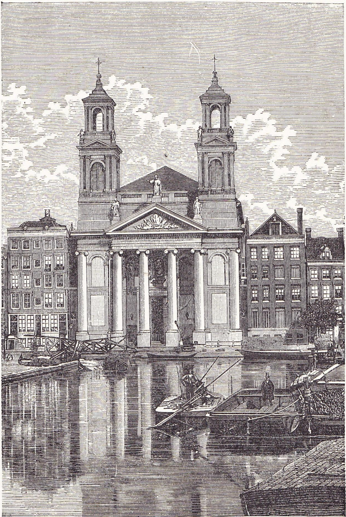
Église de Moïse-et-d'Aaron, à Amsterdam.